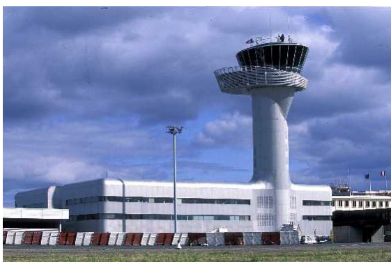
Torre de control de tráfico aéreo en el Aeropuerto de Burdeos-Mérignac

El servicio de control del tráfico aéreo , también conocido por sus siglas en inglés ATC ( Air Traffic Control ), se presta por los países firmantes de la Convención de Chicago que dieron origen a la creación de la OACI/ICAO en los términos especificados por las normas de esta organi-