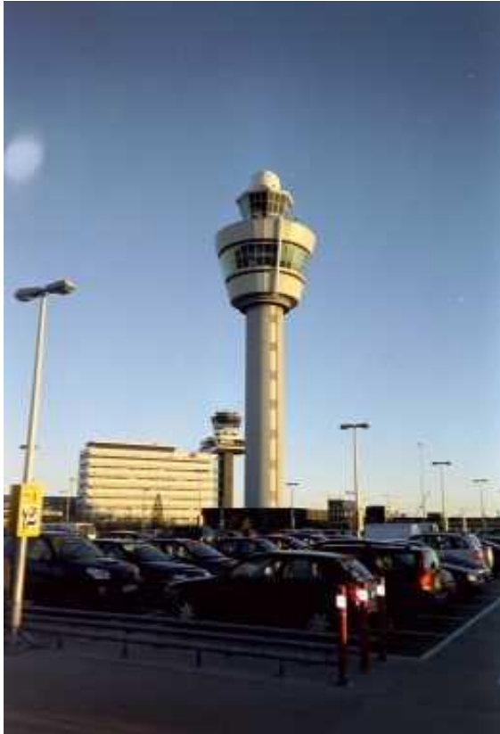
Torres de control de tráfico aéreo en el Aeropuerto de Schiphol.